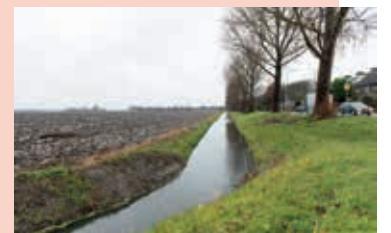
De tocht langs de Troelstralaan is verbreed.

In Zwanenburg wordt gewerkt aan maatregelen om de wateroverlast bij extreme regenval zoveel mogelijk te beperken. Nu de werkzaamheden in de Domineeslaan klaar zijn, is de tijdelijke noodvoorziening niet meer nodig. Deze wordt in de week van 19 december verwijderd. In de Domineeslaan is de capaciteit van de afvoer van het regenwater groter gemaakt. Hierdoor zal op de kruising Maria-laan/Kastanjelaan bij heftige regenbuien het water op straat fors minder zijn. Ook is een parallelleiding aangelegd en zijn de overstorten aangepast. Verder is de tocht langs de Troelstralaan verbreed om een overschot aan regenwater op te vangen. De pompen en buizen die waren geplaatst om in noodgevallen water naar de Ringvaart te pompen, kunnen nu weg. Binnenkort start de volgende fase van de werkzaamheden: de verbetering van de afvoer van de riolen in de Lindenlaan. Het park wordt voor een deel verlaagd zodat daar water heen kan lopen als het extreem veel regent. Om de overlast te beperken, is met het werk aan de Lindenlaan gewacht totdat de Domineeslaan klaar was. Tot de maatregelen was besloten nadat in de zomer van 2014 straten in Zwanenburg bij heftige regenbuien twee maal blank kwamen te staan. Ook is toen het besluit genomen om een tijdelijke noodvoorziening te plaatsen. Die is nu niet meer nodig.