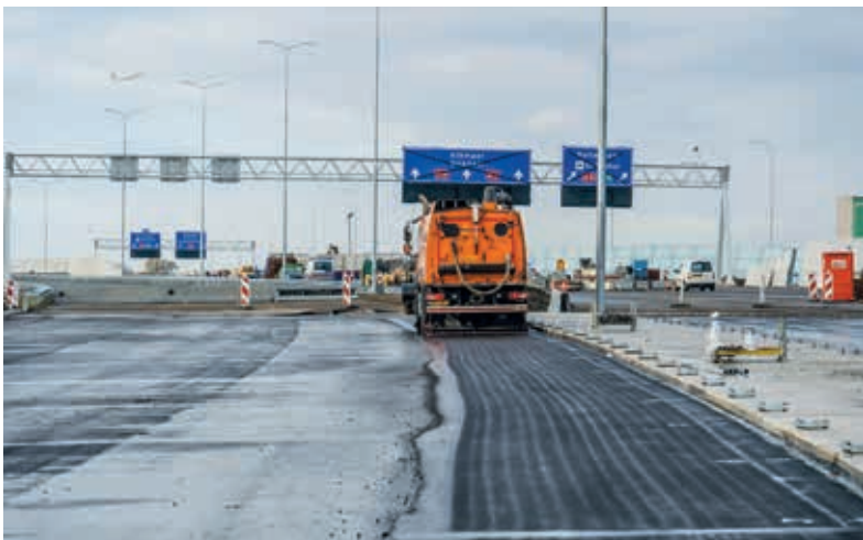
Door de werkzaamheden moeten automobilisten op de A9 en de A4 rekening houden met extra reistijd rond Badhoevedorp.

lem open voor verkeer. Dan zijn de werkzaamheden van de omliegging bij Badhoevedorp klaar.