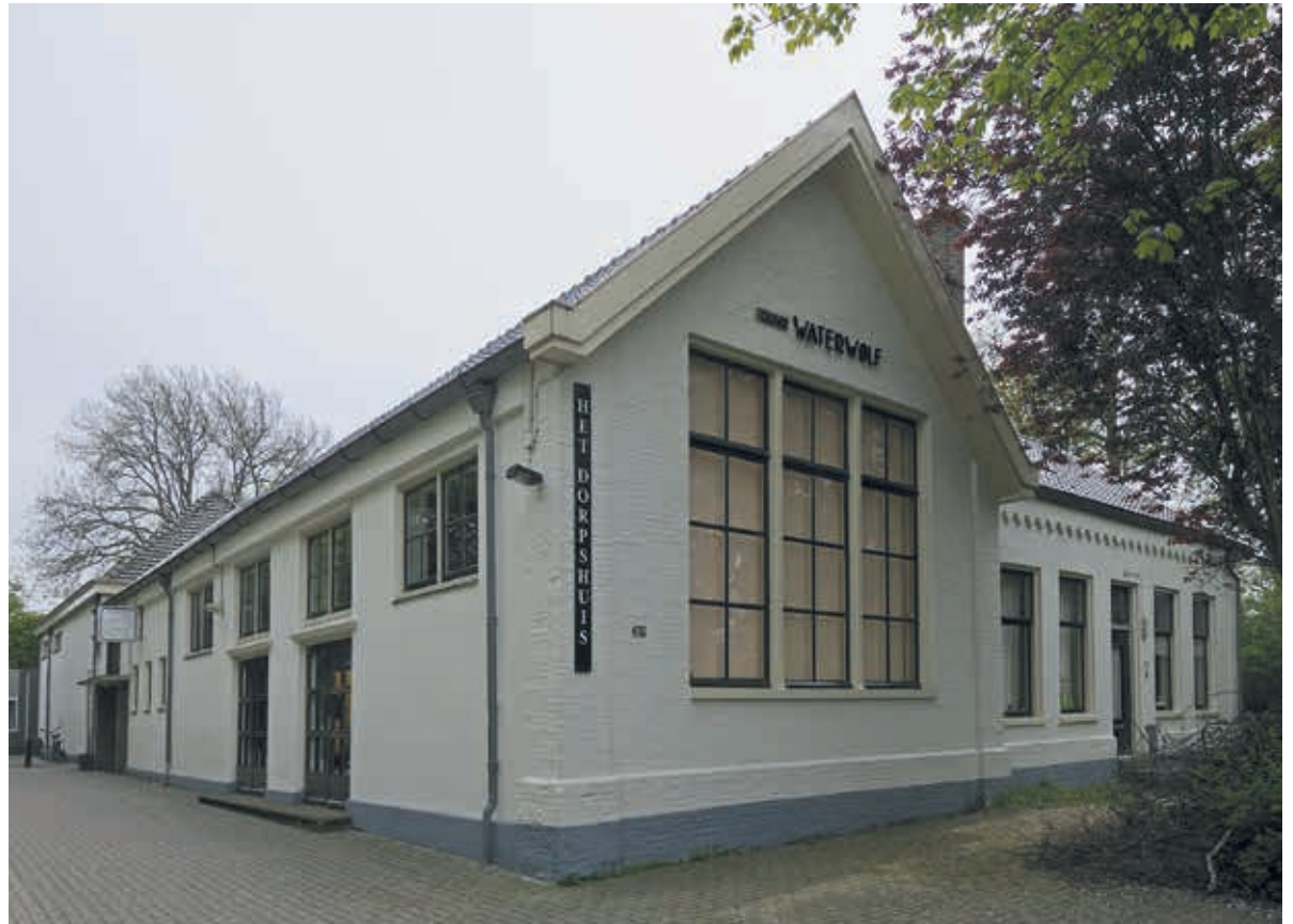
Dorpshuis De Oude Waterwolf in Vijfhuizen ondergaat binnenkort een verbouwing zodat het dorpshuis veel duurzamer wordt.

Mede om die reden komt dat dorpshuis als allereerste aan de beurt, hoogstwaarschijnlijk in januari 2017 al. Dat zal met enig (publicitair) rumoer gepaard gaan want Stichting Maatvast en de gemeente zijn van plan aan de bouwkundige maatregelen een campagne te koppelen, gericht op het vergroten van het bewustzijn van de inwoners van de