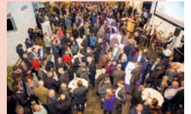
De nieuwjaarsrecepties van de gemeente Haarlemmermeer worden ieder jaar goed bezocht.