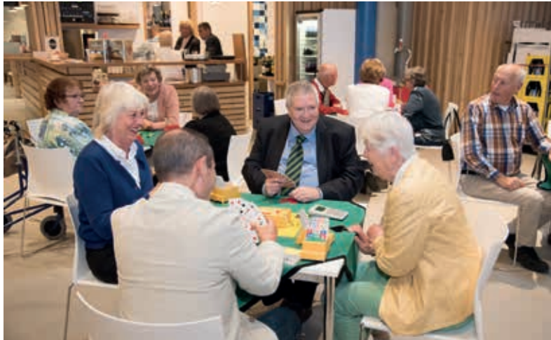
De Badhoevese Bridge Club is een van de vele clubs met activiteiten in dorpshuizen in de hele polder. Deze foto is gemaakt vlak voor de verhuizing van het oude naar het nieuwe dorpshuis in Badhoevedorp in het voorjaar van 2016.

“Maar kunnen we dat niet slimmer organiseren? Kunnen we door combineren misschien minder geld ‘in steen’ stoppen en zo meer overhouden voor